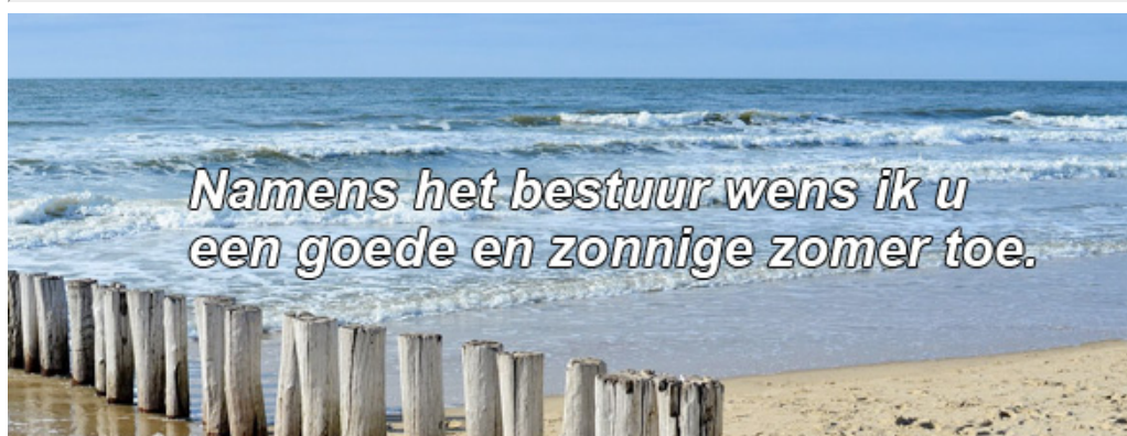
Nico Mogendorff, voorzitter

Ook in deze zomer zijn er nog diverse (buiten) exposities met glas. Een aantal zijn er vermeld op onze website kijk er gerust op.